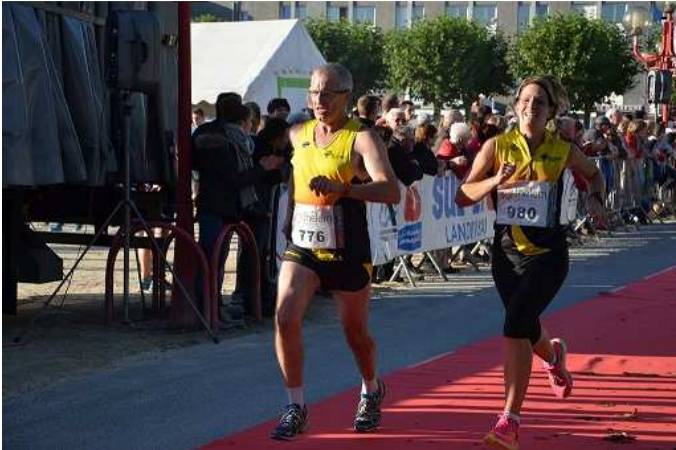
Corrida de Landivisiau