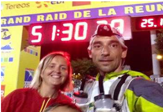
LA DIAGONALE DES FOUS