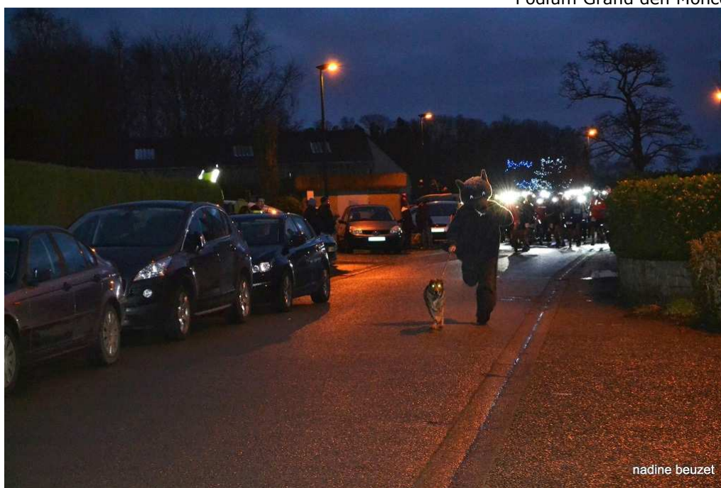
Le loup est devant !!!