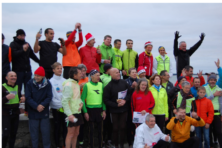
Solstice d'hiver à Moustierlin