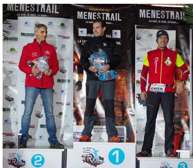
Podium Grand défi Moncontour