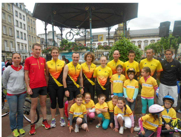
Le petit tour de France Morlaix