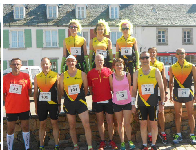
Le Ruzbou'tour de Plougasnou